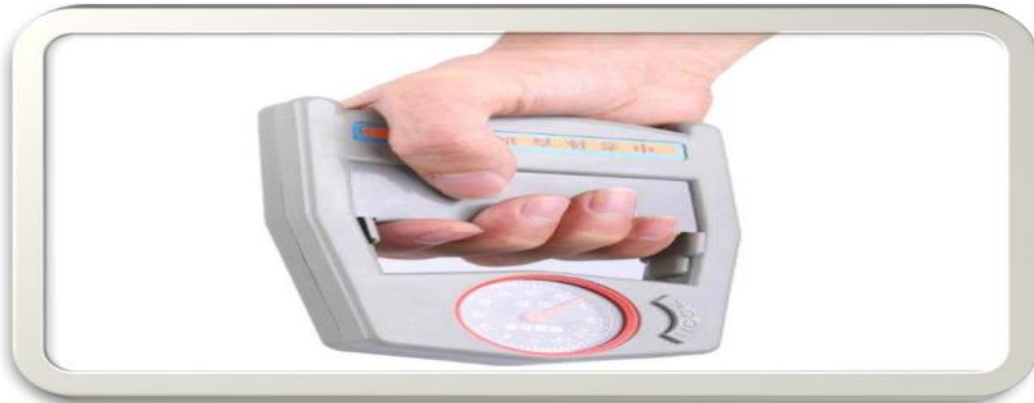
شكل (3) یوضح اختبار القوة