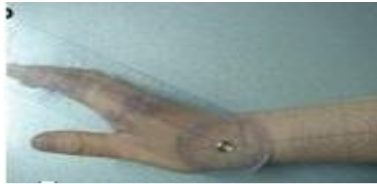
اليد عند التباعد (ب) 0 - 80