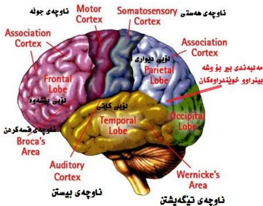
وینهی ژماره (2)

دوای ئهم قوناغه سیستهمی زمانی دهستهکات به بهرهمهینانی کۆده زمانیهکان، له (ناوچهی بهرهمهینانی زمانی- Broca's Area) دا. دوای ئهوه له ریگای کۆمهڵیک دهمارگهیاندنهوه ئهم کۆدانه جاریکی تر دهگوازرینهوه بۆ دوازه جوت دهماری ماسولکهیی له دهموچاو، که ههر جوت دهماریکیان بهرپرسه له درکاندنێ کۆمهڵیک دهنگ (فون)، که دواچار لهریگای ئورگانهکانی ناخواتنهوه (لیو، زمان، مهلاشوو، ددان، تاله ژیههکانی قورگ...) سازگهیان بۆ دروستدهکریت، له ئهنجامی فریدانی تهوژمی ئهو ههوایهی، که له سییهکانهوه به ماسولکهکانی بۆریی ههناسه و تاله ژیههکانی قورگدا تێپهر دهبن و دهنگهکان دروستدهبن و له دم دینه دهرمه. ئهمهش کۆی پرۆسهی سیستهمی بهرهمهینانی زمان، له لای مرؤفا.