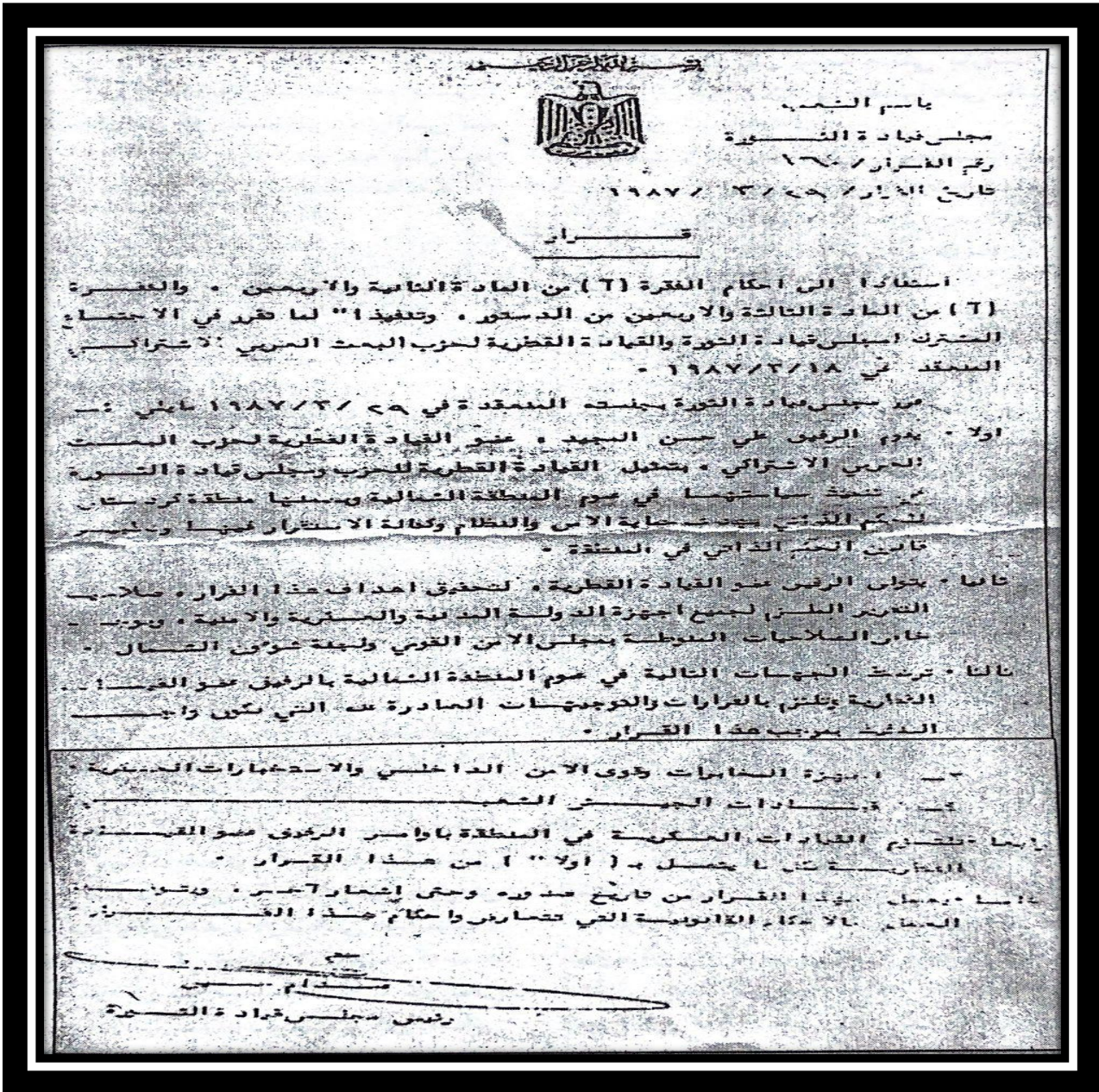
سەرچاوه: كهيوان نازاد نهنومر (دكتور)، تاوانبار ه گهور مكهه كيميابار انكر دني شاري هه لهجه، گوفاري رينبري پيشمهركه، ژ(101)، 2009.