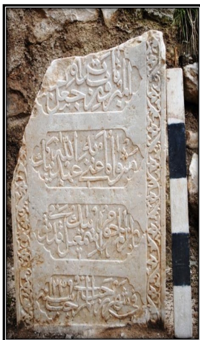
وینهی ژماره ۶ (تویژهران)