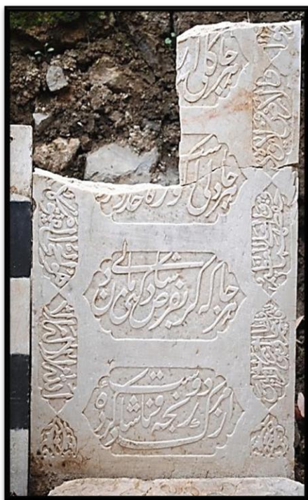
وینهی ژماره ۳ (تویژه ران)