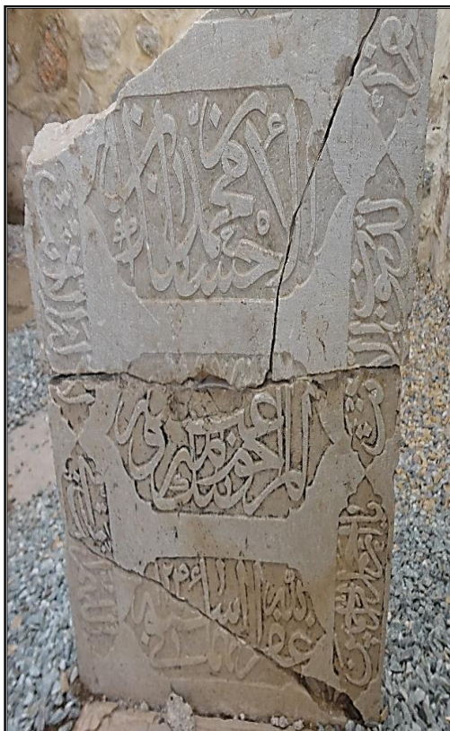
وێنه‌ی ژماره ۲ (تویژه‌ره‌ان)