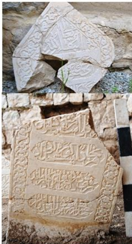
وینیهی ژماره ۹ (تویژمران)