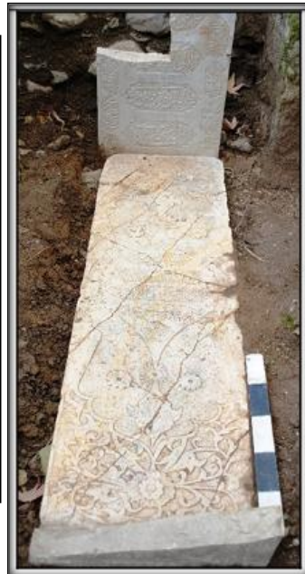
وینهکانی ژماره ۵ (تویژهران)