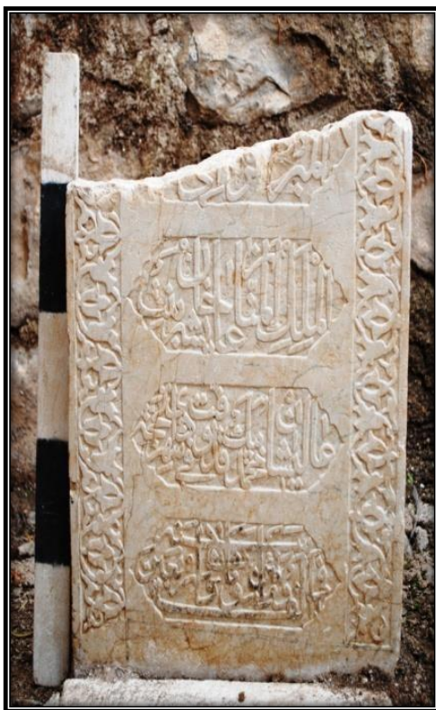
وینەي ژمارە ۸ (تویژمران)