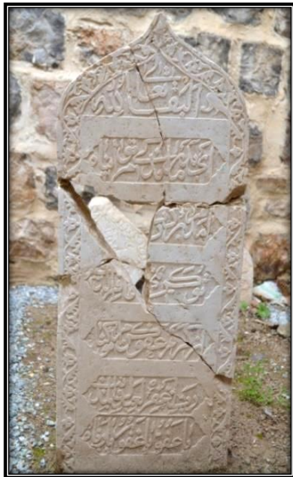
وینهی ژماره ۷ (تویژهران)