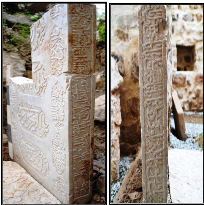
وینهکانی ژماره ۴ (تویژهان)

لای راست له سهرهوه بۆ خوارهوه: (یا غنی - ئەهی دهلهمهندی بی سنوو له هیز و دهسهلات له زانست و زانیاری له مال و ساماندا)، (یا مغنی - ئەهی ئەو زاتهی وادهکهیت پیویستمان به کهسی تر نهیت)، (یا مانع - ئەهی رینگر له ههموو شتیک که خوت نهتهویت بیهخشیت)، (یا ضار - ئەهی زیانگهیهنهر به ههر کهسێک که ویستت له سهری بیت)، (یا نافع - ئەهی سود بهخش بۆ کهسێک که بهتهویت)، (یا نور - ئەهی نور و رووناکي)، (یا هادی - ئەهی رینمونیکاری دروستکراوهکانت)، (یا بدیع - ئەهی دروستکاری ههموو دروستکراوهکان)، (یا باقی - ئەهی مانهوی بهردهوام)، (یا وارث - ئەهی میراتگری ههموو شتیک و ههموو کهسێک)، (یا رشید - ئەهی دامهزراوه لهسهر حهق و راستی و دوور له ههموو ناتهواوی و ناپاکیهک)، (یا صبور - ئەهی لهسهرخۆ و به ئارام) (گهردی، ۲۰۱۳، ۳۶۷-۳۴۹) (مهیدانی، ۲۰۲۳).