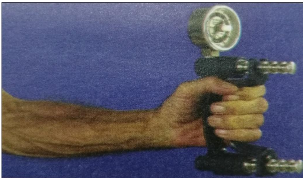
شكل (2) جهاز قوة قبضة اليد (Hand Grip Strength)