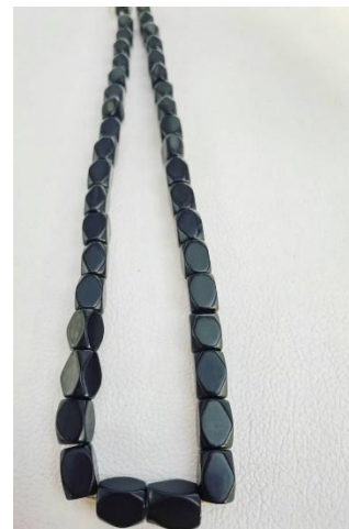
۲- ۱۳ زێر (زەر)

رەش بە (شەبە) بزانی وەک ئەوەی لە فەرھەنگی ھەنباھە بۆرینەدا ھاتوو و تاییەت نەکراوە بە جۆرە بەردیکی دیاریکراو. لە سەرچاوە عەرەبییەکاندا ئاماژە بە (المرو) کراوە، کە مەبەست (کواری تزی خۆلەمیشی و رەشە)، (مەھا) و (بلوور)یشی پێدەگوتریت، ھەمووشیان جۆریکن لە کواری تزی، بەپێی بوونی خەوش رەنگی جیاواز و ھەردەگرن، وەک (زەرد، قاوەی و وەنەوشەیی و سەوز و خۆلەمیشی) (عقیل، ۲۰۰۷: ۶۶۷)، دەشی (نالی) ئاشنای ئەو جۆرە کواری تزی رەنگ خۆلەمیشییە بریقەدارەش بووبی، کە (المرو)ی پێدەگوتریت و بە زۆلفی مەعشوقەکەیی خۆی چواندبیت. شەو موروویەکەیی رەشە، نەرمە لە جۆری کەرمان و کاربە، کە دەبخشیتیت لە دەست نەرمە، ھەموو ژنی کورد ھەیانبوو.