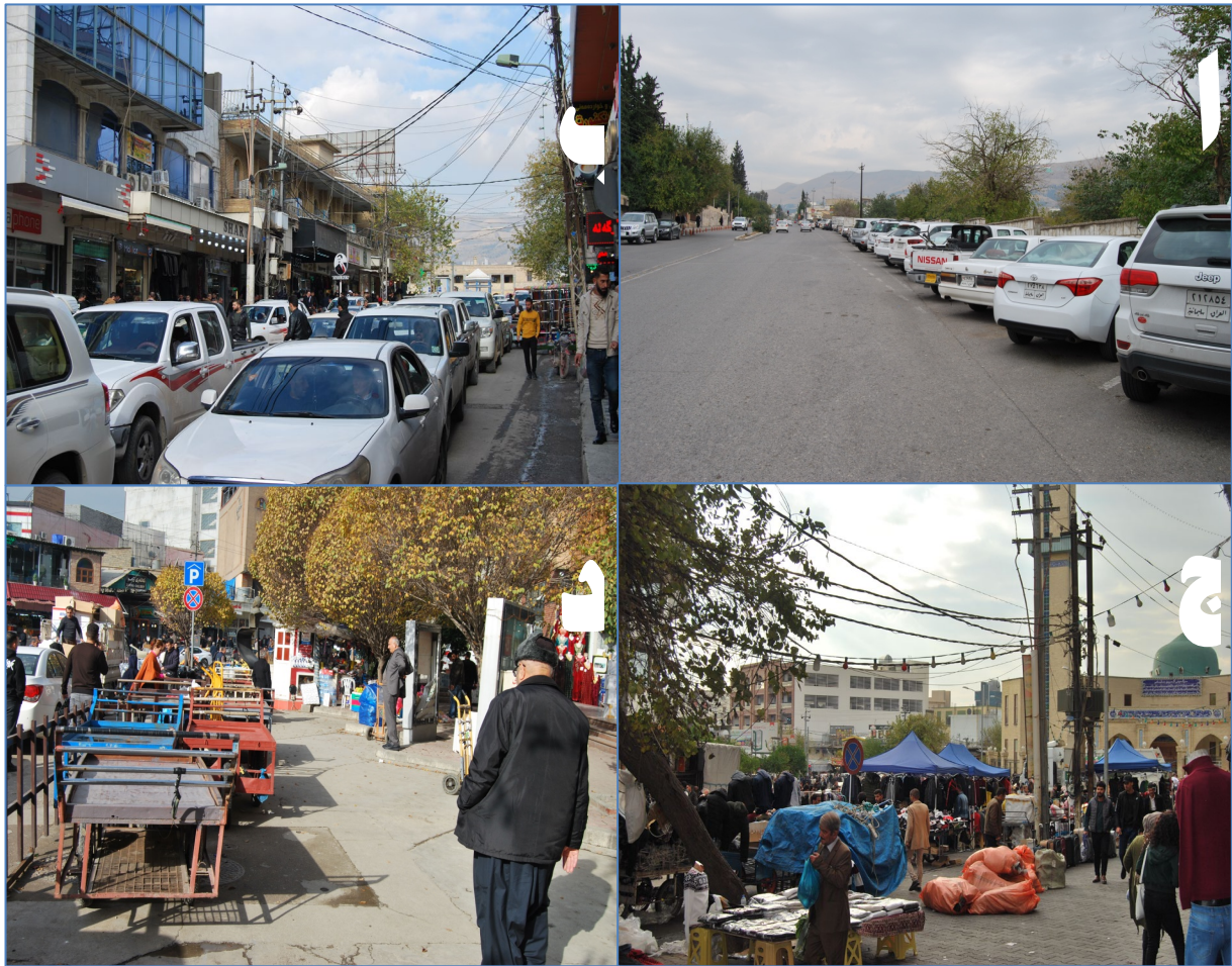
وېنە ۷: بېسبون بهھۆى ھۆكارەكانى گواستنەوہ و پاركردنيان (كارى مەيدانى توپژەران لە رېكەوتى ۲ / ۱۱ / ۲۰۱۹).