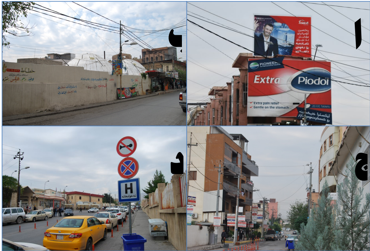
وینە ۲: پیسبوون بهۆی تابلۆکان (کاری مهیدانی توێژه‌ران له رێکه‌وتی ۲/ ۱۱/ ۲۰۱۹).

بوونی ژماره‌یه‌کی زۆر له وایه‌ر و کێبێلی کاره‌با و بورجی مۆبایله ناوچه‌ی لیکۆلینه‌وه‌دا، وایکردووه پله‌ی سییه‌م هه‌بێت که ۱۸۶ به‌شداربوو که ده‌کاته ۶۲%، له کۆی ۳۰۰ به‌شداربوو وه‌ک هۆکارێک بۆ پیسبوونی بینین ناساندووایه‌. هه‌روه‌ها ۲۲۸ به‌شداربوو ۷۶%، پێیانوایه پیسبوونی بینین به وایه‌ر و کێبێلی کاره‌با و بورجی مۆبایله ئاستیکی به‌رزدايه، ۶۳ به‌شداربوو که ده‌کاته ۲۱% ئاستیکی مامناوه‌ند و ۹ به‌شداربوو ۳ که ده‌کاته %ئاستیکی نزمیان دیاریکردووه.