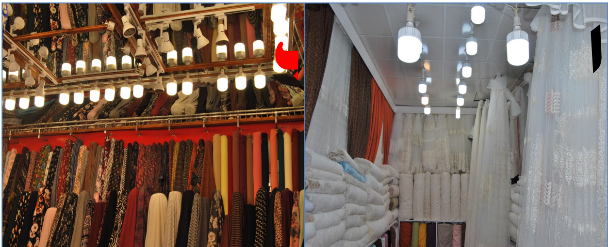
وېنە ۸: بېسبون بهھۆى بەكارھينانى رووناكى زياد لە پيوست (كارى مەيدانى توپژەران لە رېكەوتى ۲ / ۱۱ / ۲۰۱۹).