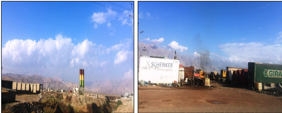
گیراوه له رێکهوتی (۲۰۱۹/۱۱/۱۰).