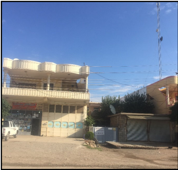
گیراوه لە رێکەوتی : (2019/11/10).