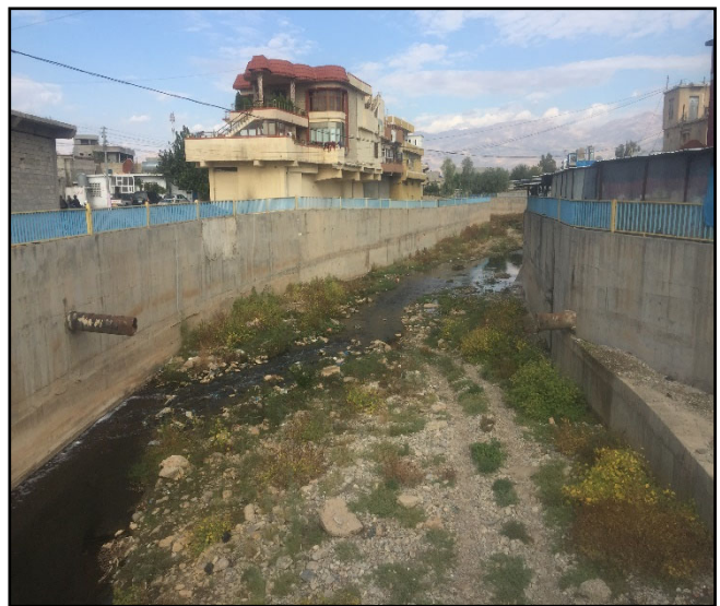
گیراوه له رێکهوتی : (۲۰۱۹/۱۰/۲۷).