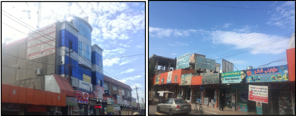
گیراوه له رێکهوتی : (۲۰۱۹/۱۱/۳).