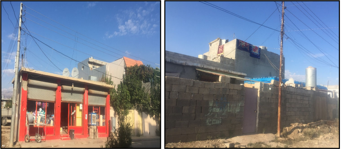
گیراوه لە رێکەوتی : (۲۰۱۹/۱۱/۲۷).