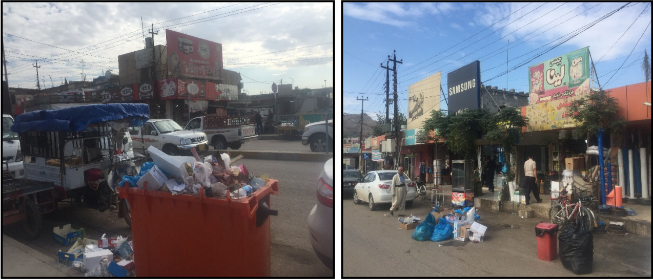
گیراوه له رێکهوتی (۲۰۱۹/۱۱/۳).